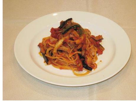
秋茄子ときのこのスパゲティ